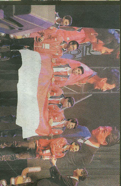
Tim Indonesia yang diwakili oleh para mahasiswa Institut Teknik Bandung yang menjadi runner up II ABU Robocon 2015