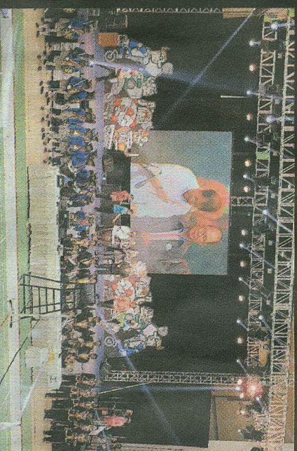
Menkominfo Rudianegara saat membuka kontes Internasional ABU Robocon 2015 di Sportorium UMY pada 24 Agustus 2015 lalu.

"Walaupun sama-sama menjadi tuan rumah dari penyelenggaraan lomba badminton internasional, hanya sedikit perbedaan yang ada. Kalau kejuaraan badminton dunia yang main semuanya manusia. Sekarang,